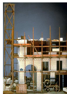
Immeuble en construction de la rue de Rivoli, Inv. 09504

Les participants découvrent la richesse du musée à travers ses chefs-d'œuvre.