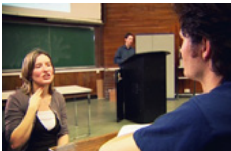
Transmission du message oral.

Les financements émanent normalement du ministère de l'Enseignement supérieur (c'est le cas à l'Université) ou du ministère de l'Éducation nationale (c'est le cas pour les BTS). Les cellules « handicap » des universités ou les établissements d'enseignement eux-mêmes ont mission de faire les démarches nécessaires pour les obtenir. En certains cas, les étudiants emploient eux-mêmes un codeur pour des heures complémentaires ; ils financent cet emploi avec le « forfait mensuel surdité », dans le cadre du versement de la prestation de compensation (PCH aides humaines) attribuée par la MDPH.