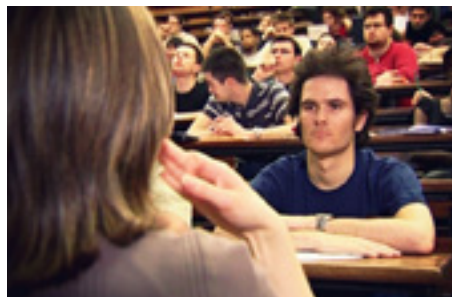
Reception du message oral.